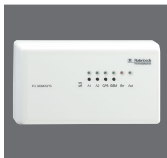
Schulalarm-System TC GSM/GPS 700 902 600

Wenden Sie sich an einen örtlichen Elektroinstallateur, der Ihnen das System problemlos einrichtet, oder sprechen Sie uns direkt an.