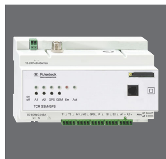
Schulalarm-System TCR GSM/GPS 700 802 600

System für Wandmontage; reinweiß (ähnlich RAL 9010); 143 x 81 x 28 mm; 438 g